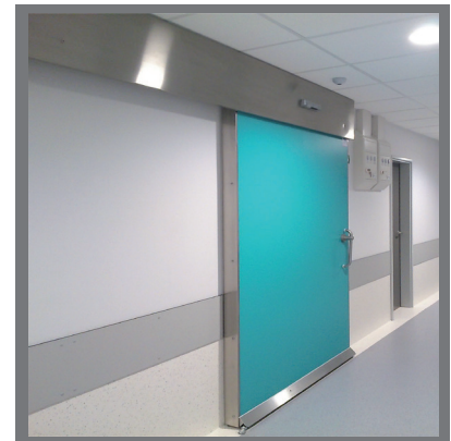
MODELO | TH7 EI MODEL

Hermetic Soundproof door for critical areas with noisy machinery