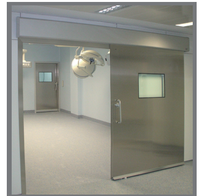
MODELO | TH7 SH MODEL

Hermetic sliding door for operating theatres with the robustness of always