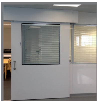
MODELO | TSC1 MODEL

Medical doors for X-ray rooms, bunkers with radioprotection