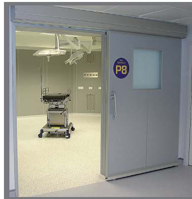
MODELO | TH7 MODEL

Hermetic door with flush leaf for OT rooms, laboratories & cleanrooms