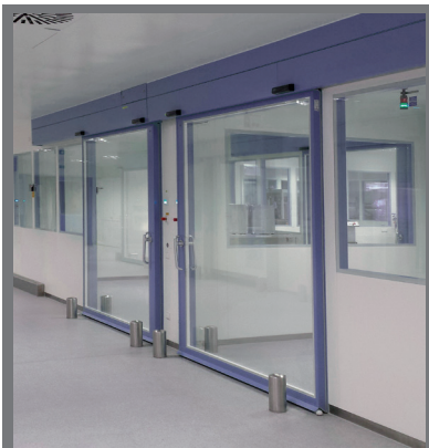
MODELO | TH7 GH MODEL

Full stainless steel hermetic sliding door for operating theatres