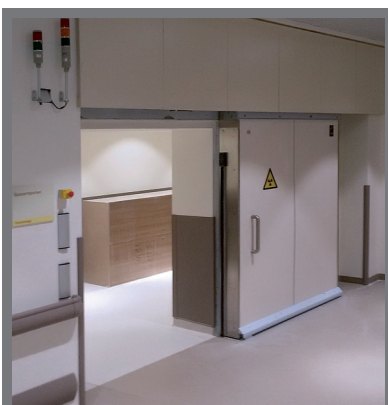
MODELO | Pb / MRI MODEL

Certified hermetic 30/60/90 min fire-rated door