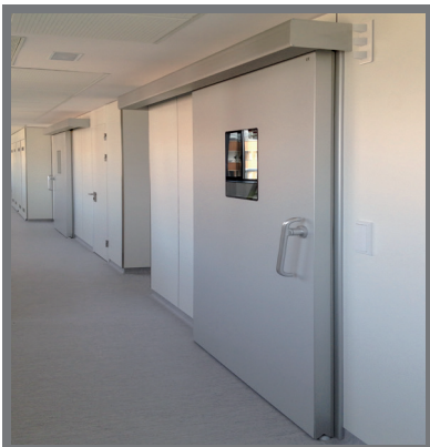
MODELO | TH8 MODEL

Puerta hermética de hoja enrasada para quirófanos, laboratorios y salas blancas